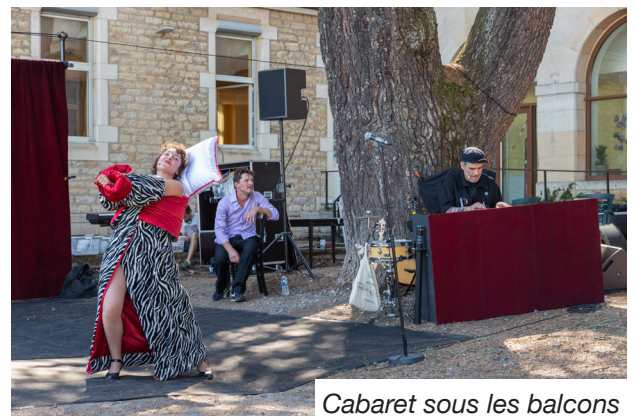
Cabaret sous les balcons