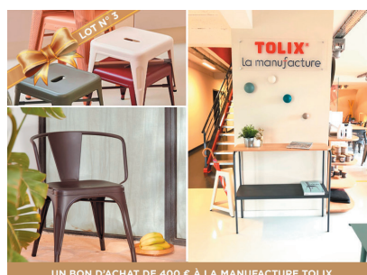
UN BON D'ACHAT DE 400 € À LA MANUFACTURE TOLIX