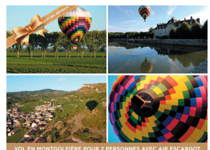
VOL EN MONTGOLFIERE POUR 2 PERSONNES AVEC AIR ESCARGOT