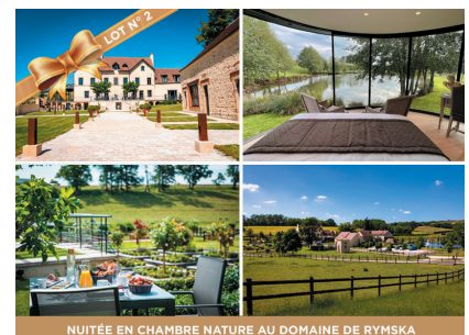
NUITEE EN CHAMBRE NATURE AU DOMAINE DE RYMSKA