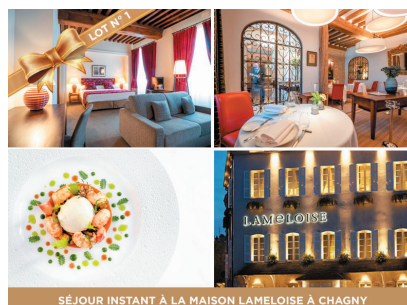
SEJOUR INSTANT A LA MAISON LAMELOISE A CHAGNY