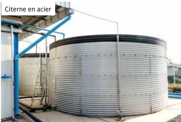
Tonne à eau